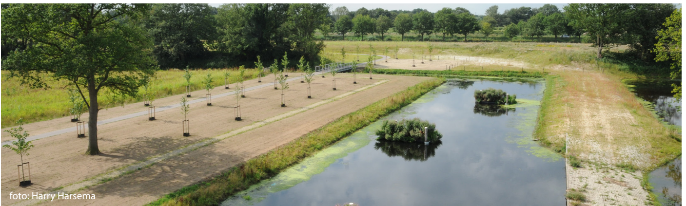
Inlaatbassin voor de watermachine