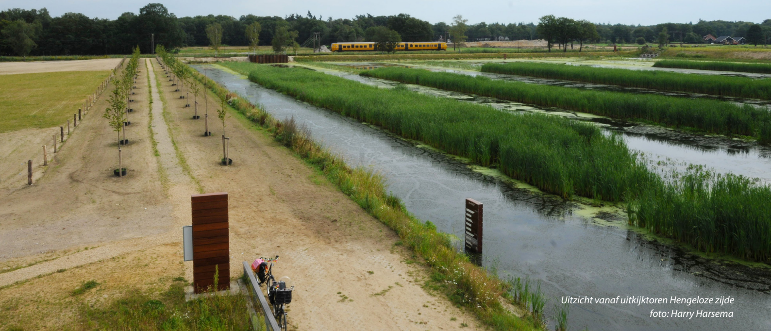
Uitzicht vanaf uitkijktoren Hengeloze zijde