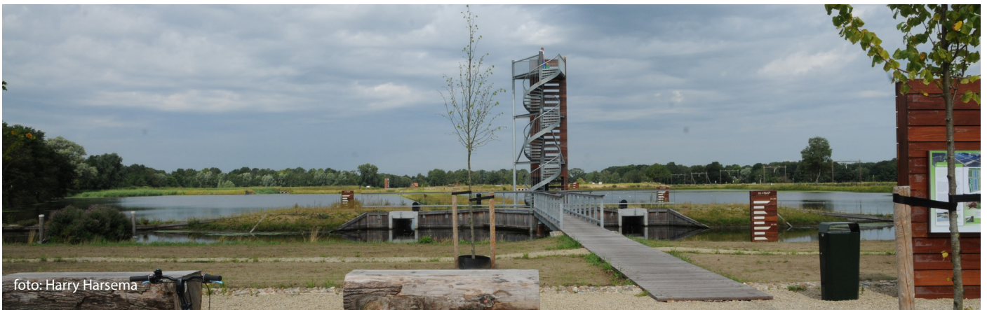
Uitkijktoren en verblijfsplek aan Enschedese zijde