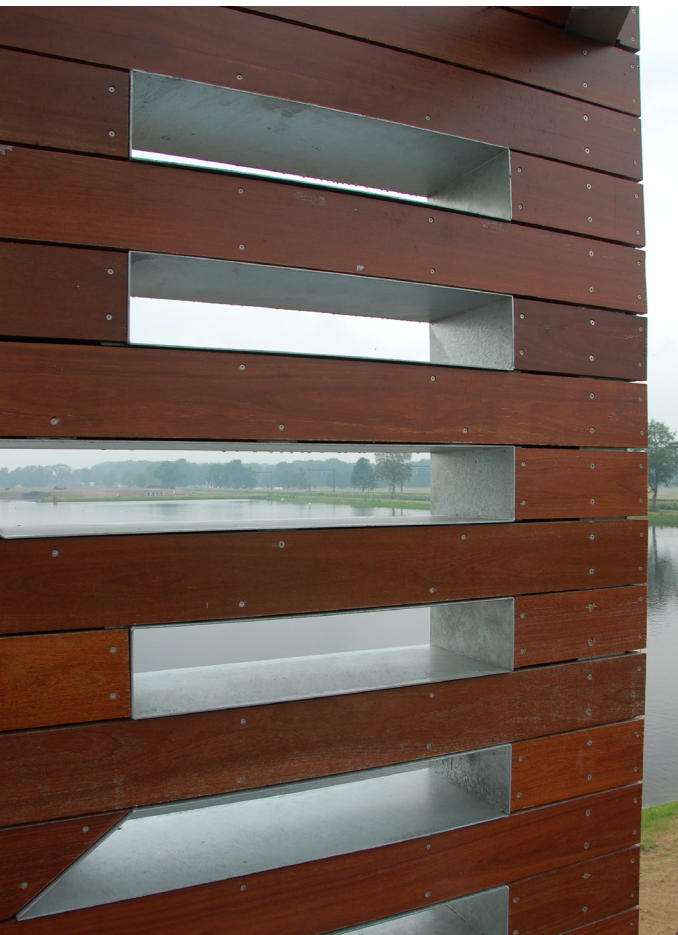
Detail peillatmotief in uitkijktoren

In de Voorbeeldenbank ruimtelijke kwaliteit van de provincie Overijssel wordt over het Kristalbad het volgende gezegd: “De belangrijkste factor voor het vergroten van de ruimtelijke kwaliteit was in feite de strategische keuze om het gebied (tussen Enschede en Hengelo) ‘groen’ te houden. Vervolgens toonden de partijen lef door niet alleen vanuit eigen doelstellingen te denken. Dat leverde een bijzonder ‘streepjescodes-ontwerp’ op. “De opgave was om de diverse doelstellingen voor het gebied in te passen. Dit is gedaan door een aantal gezamenlijke schets-sessies (...). Het gevaar is dan dat iedereen vanuit zijn eigen doelstellingen denkt. Dat idee werd gaandeweg losgelaten en sloeg om in een sfeer waarbij de partijen met elkaar keken hoe ze zoveel mogelijk doelstellingen konden bereiken. Abe Veenstra was hierbij de leidende architect, die de partijen bij de hand heeft genomen. Als onafhankelijke architect was hij in staat om bepaalde originele elementen erin te brengen, zoals de ‘streepjescode’ en het idee om een ‘peilschaal’ op verschillende plekken te laten terugkomen.”